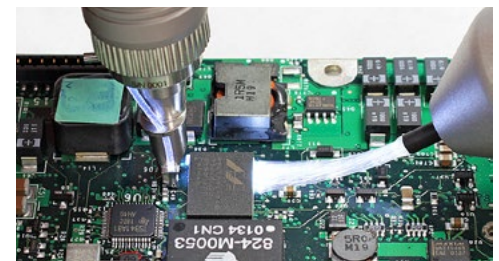
Inspektion eines Micro-BGA

Umfangreiches Zubehör erlaubt es dem Anwender, sich das Ersa mobile scope nach seinen individuellen Bedürfnissen zusammenzustellen. Der praktische Transportkoffer sorgt für eine sichere Lagerung des Inspektionssystems und erleichtert die schnelle Verwendung an verschiedenen Einsatzorten.