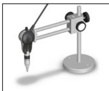
Stativeinheit OVSST065 mit Ersa MOBILE SCOPE