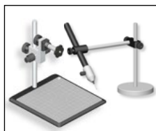
Stativeinheit & Halter für LED Faserlicht