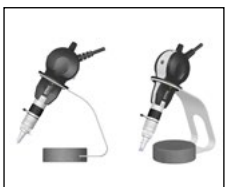
Ablage für Ersa MOBILE SCOPE