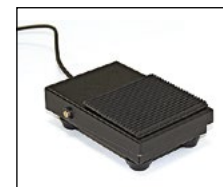
Fußtaster zur Bildauslösung